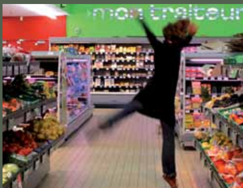
La Compagnie Hendrick Van Der Zee viendra à la rencontre des habitants afin de créer un spectacle imprégné du territoire

La Veillée # 35 - Côtes d'Armor. Compagnie Hendrick Van Der Zee (Nord-Pas-de-Calais). Production : Compagnie Hendrick Van der Zee. Culture Commune scène nationale du Bassin minier du Pas-de-Calais. Avec le soutien de la DRAC Nord-Pas-de-Calais, du Conseil Régional du Nord-Pas-de-Calais, du Conseil Général du Pas-de-Calais. Coproduction Itinéraires Bis (Association de Développement Culturel et Artistique des Côtes d'Armor). Organisée par Itinéraires Bis, le Réseau au fil de l'eau, le Leff Communauté et la Communauté de Communes du Pays de Belle-Isle-en-Terre