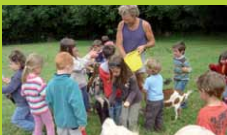
En février, le service animation jeunesse proposera des activités pour les 3/11 ans.