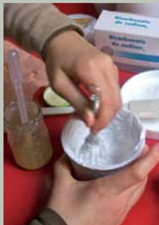
En mars, le CRIR vous invite à la découverte de la confection de produits ménagers ou cosmétiques « fait maison ».

En mars, le Centre Régional d'Initiation à la Rivière de Belle-Isle-en-Terre propose deux stages originaux de confection de produits ménagers naturels et de cosmétiques au naturel.