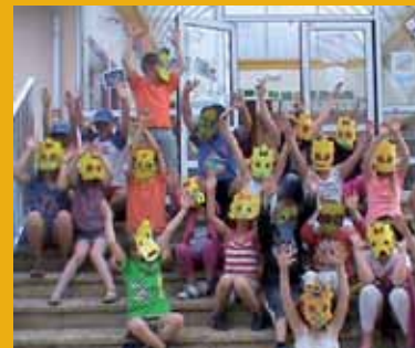
Accueil de loisirs - Été 2013